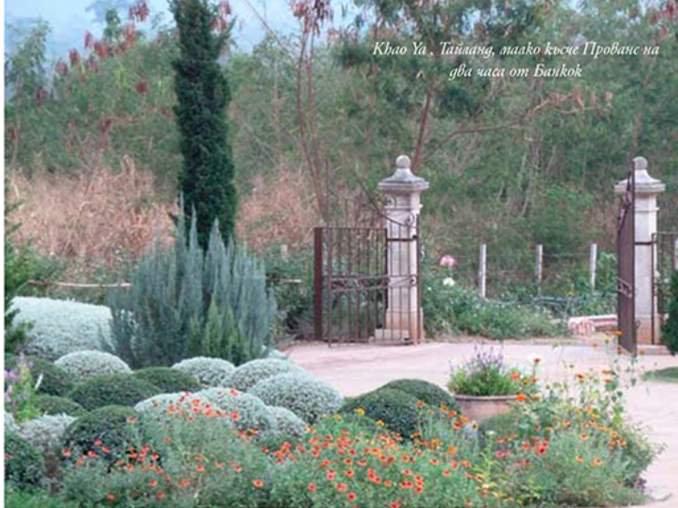
Khao Yai, Тайланд, малко късно Прованс на два часа от Банкок