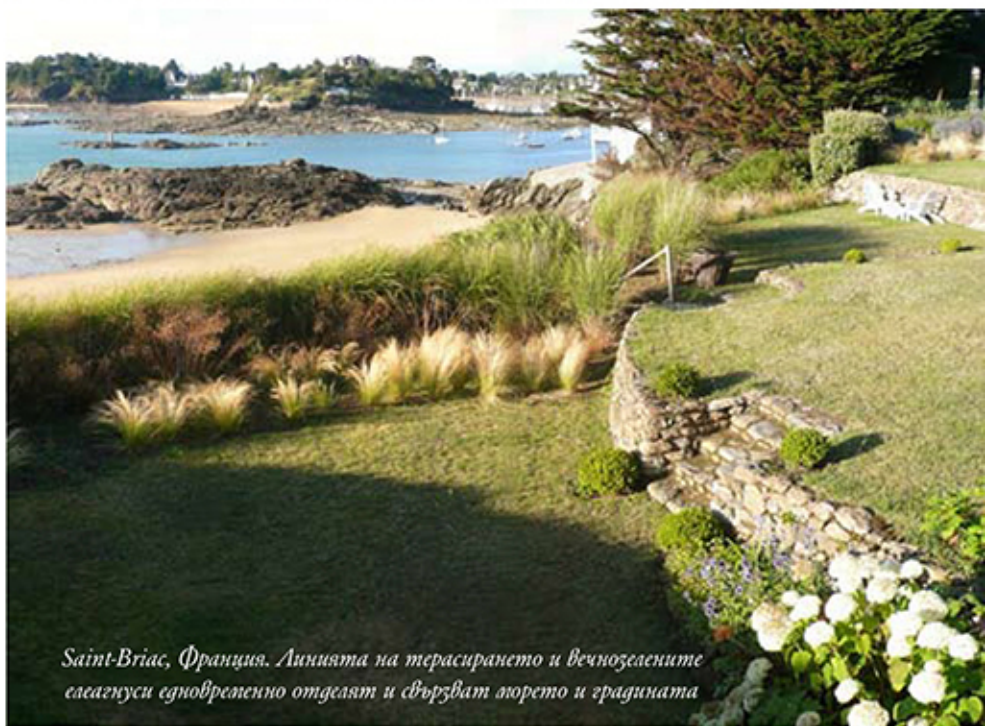
Saint-Briac, Франция. Линията на терасирането и вечозелените саеагнуси едновременно отделят и свързват морето и градината